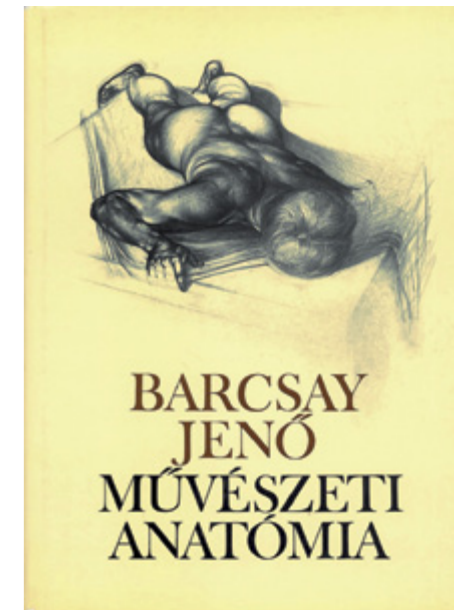
Barcsay Jenő Művészeti anatómiáját ma a Corvina Kiadó adja ki

A vaskos atlasz igazi művészeti kézikönyv, nem sok köze van az orvosi bonctanhoz. Barcsay geometrikus idomok segítségével elemezte a csontok kapcsolódási pontjait, ugyanazzal a szerkezet-kereső elhivatottsággal kutatta a látvány mélyén a struktúrát, ahogy festészetének legjobbjain, a vaskos kontúrokkal meghúzott műtermi csendéleteken. A bevezetőben is hangsúlyozta, hogy nem használt fényképet (annál több klasszikus német szakkönyvet), hiszen neki „értelmes” látásra volt szüksége, a test egészének összefüggésrendszerére és a lényegtelen, esetleges részletek elhagyására. Csak egy helyen esett ki az absztraháló analitikus szerepből, amikor a női mell tanulmányozva izomkolosszusokat rajzolt pici almácska-keblekkel. (Nem lehet véletlen, hogy a művészettörténész reflexek annak a Michelangelónak a női monstriumait juttatják az eszünkbe, akit szintén nem fűztek gyengéd szálak a gyengébbik nemhez.) Az asszonyok robusztus teste és picassósan klasszicizáló arca pedig a hatvanas évekbeli, állami megrendelésre készült, monumentális művek munkásideálját előlegezik meg, amit mozaik formájában maga Barcsay is jó párszor elis-