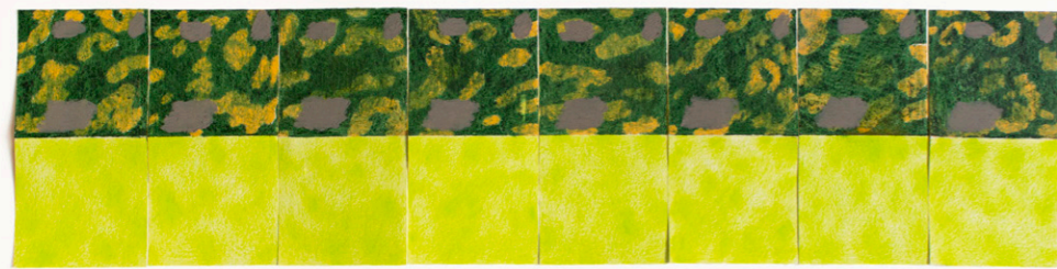
Zöld elemek, 2021, olajpasztell és ceruza papíron, 10 x 20 cm egyenként

Jelenleg tizenhárom elem alkotja a sorozatot. A korábban tobzódó mély zöldek helyett előtérbe kerül, hogy dominálhasson, a különösen világos, vitális zeller-zöld, amit az alkotás időszakával, az első, igazán tavaszi életérzésű napokkal magyarázok. Így kerülök relációba a környezetemmel a munka által. Az olajos, visszakaparás által több réteget felfedő, összetett felület és a lapos, vékony ceruza-oldal kontrasztja fontos jellemzője a daraboknak. Hierarchikus viszony nélkül, egymás mellé helyezve hasonlítom össze és társítom ezeket az anyagokat.